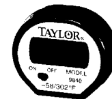
Termómetro digital Área sensible de 1/2"