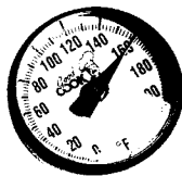
Termómetro dial Área sensible de 2"

3 minutos más antes de comer la carne de res, ternera, cerdo y cordero